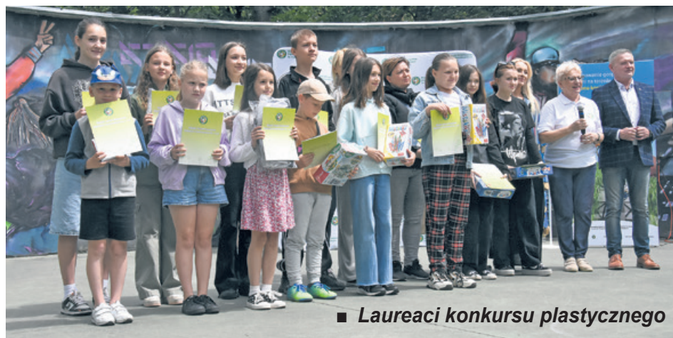
■ Laureaci konkursu plastycznego

Prace laureatów konkursu plastycznego można obejrzeć na stronie MZGOK ( www.mzgok.konin.pl ).