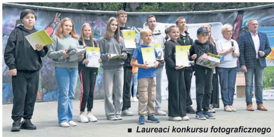
■ Laureaci konkursu fotograficznego