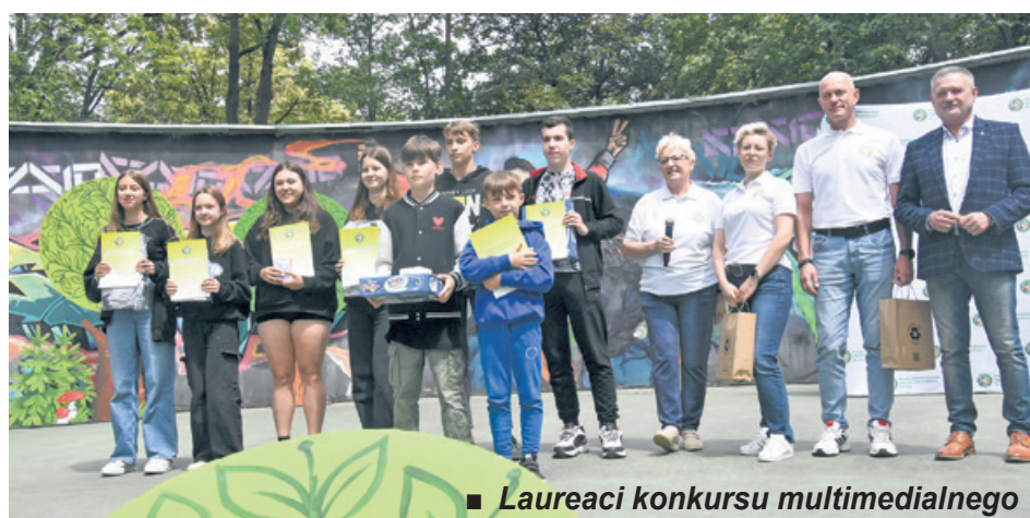
■ Laureaci konkursu multimedialnego