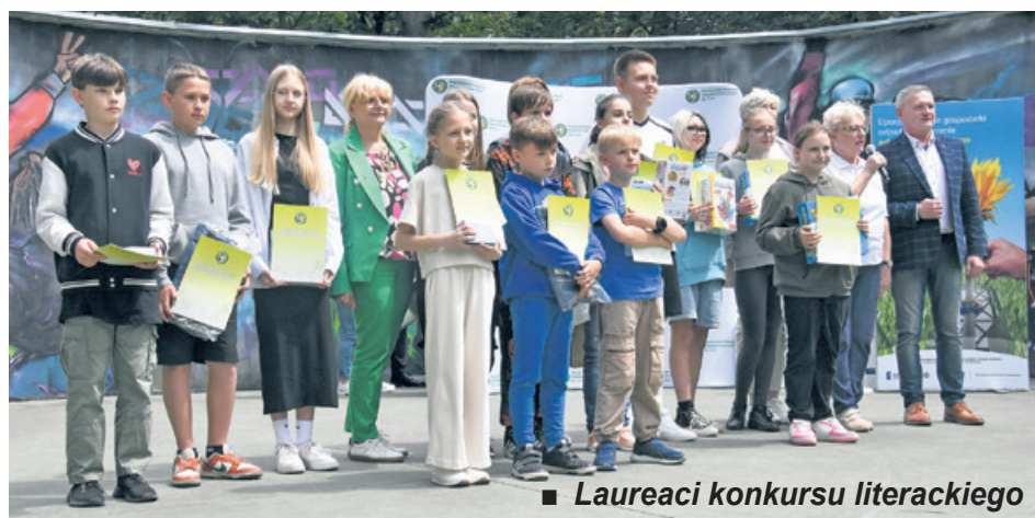
■ Laureaci konkursu literackiego