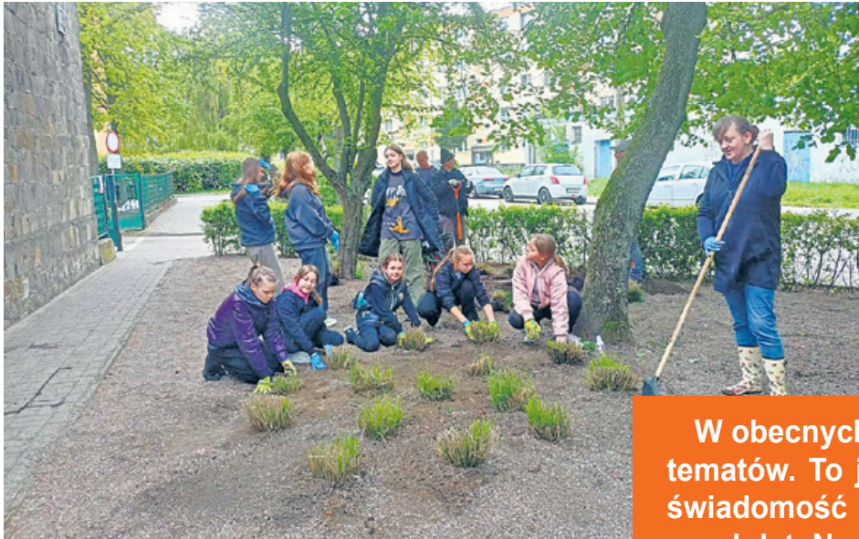
■ Uczniowie z kółka ekologicznego w SP4 sadzili trawy ozdobne